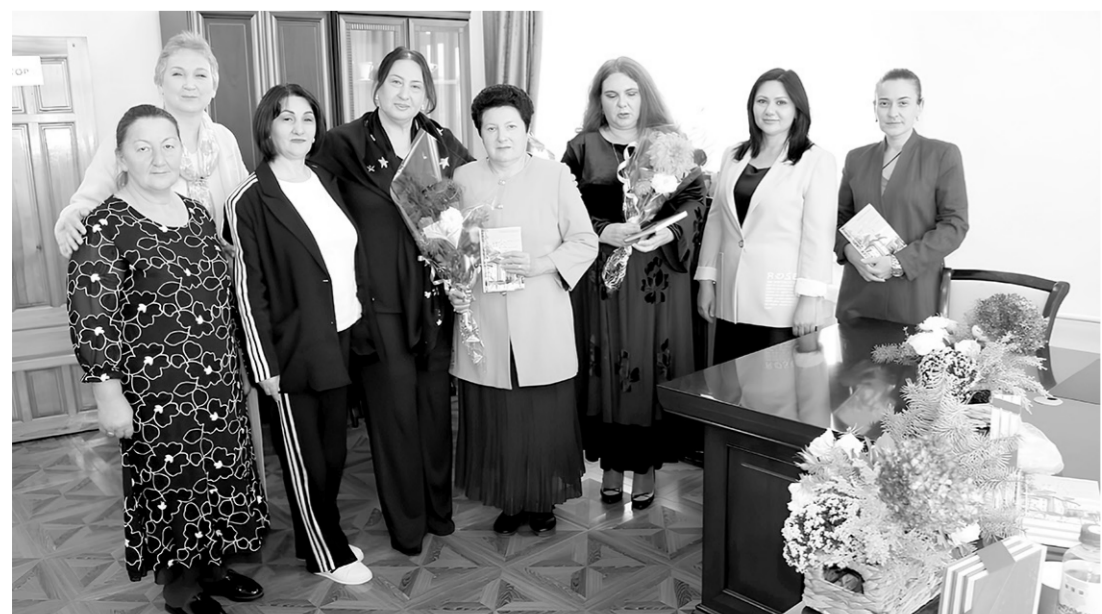
Участники встречи с виновницами торжества

Еще больше интересных новостей на сайте denresp.ru