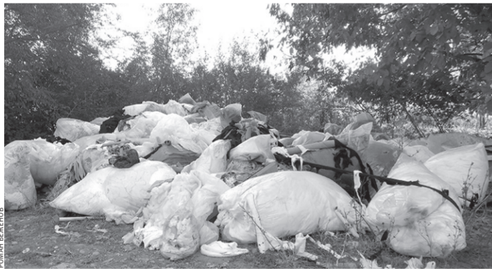
Такие кучи мусора можно увидеть в республике повсюду

Туда же, только немного западней, мы в июне всегда ездили собирать ароматную землянику, частенько с удовольствием «шашлычили», всегда тщательно убирая за собой. Более того, собирали и мусор тех, кто не потрудился это сделать, оставив на зеленой полянке малоприятные следы своего пребывания. Но лет десять назад эту полюбившуюся многим пригородную зону отдыха постепенно стали захламлять. Сначала просто отходами после пикников, потом — уже привозным мусором. Не таюсь и ничего не боюсь, открыто приезжали легковые и грузовые машины, вываливали всевоз-